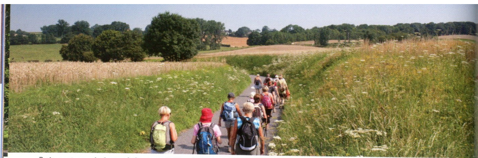
Petite route encaissée vers le hameau du Festel. -DD-

⚔ Chapelle Saint-Gervais sur la traverse du Ponthieu (variante)