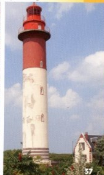
Le phare de Brighton. -DD-

★ Chemin des Planches • Mollières de Cayeux • Exploitation de galets • Bois des Pins • Station balnéaire de Brighton